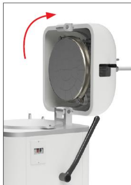
Przechyl głowicę na prawą stronę