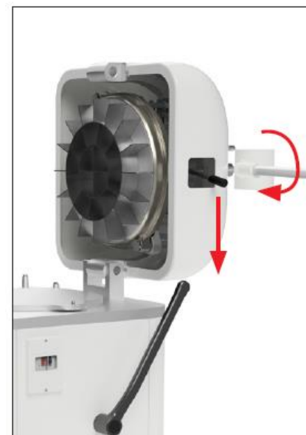
Łatwo i bez wysiłku wyczyść noże i głowicę