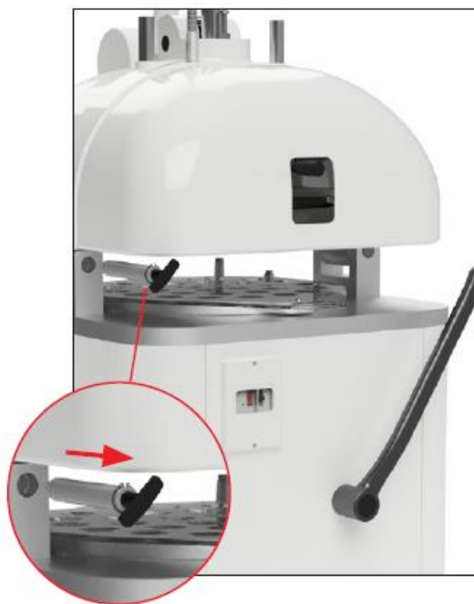
Odblokuj bolec blokujący