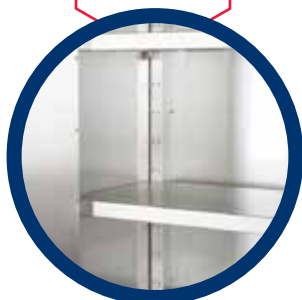
regulacja półki co 80 mm

Stal nierdzewna AISI 304 z której wykonana jest nasza szafa, jest łatwa w utrzymaniu czystości. Nie pochłania wilgoci, dzięki czemu jest odporna na korozję, większość rozpuszczalników i chemikaliów organicznych. Nie pochłania zapachów. Nieporowaty materiał jest odporny na bakterie i zarazki zdecydowanie bardziej niż drewno lub plastik. Jest to główna cecha, dla której szafy ze stali nierdzewnej są powszechnie stosowane w gastronomii, piekarniach, cukierniach, restauracjach i innych zakładach przetwórstwa spożywczego.