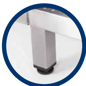
regulowane nogi do 30 mm