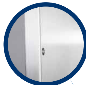
podwójne poszycie drzwi